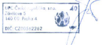
Jiří Juráš Oddělení dokumentace

Vyjádření vydala společnost UPC dne: 4.6.2016